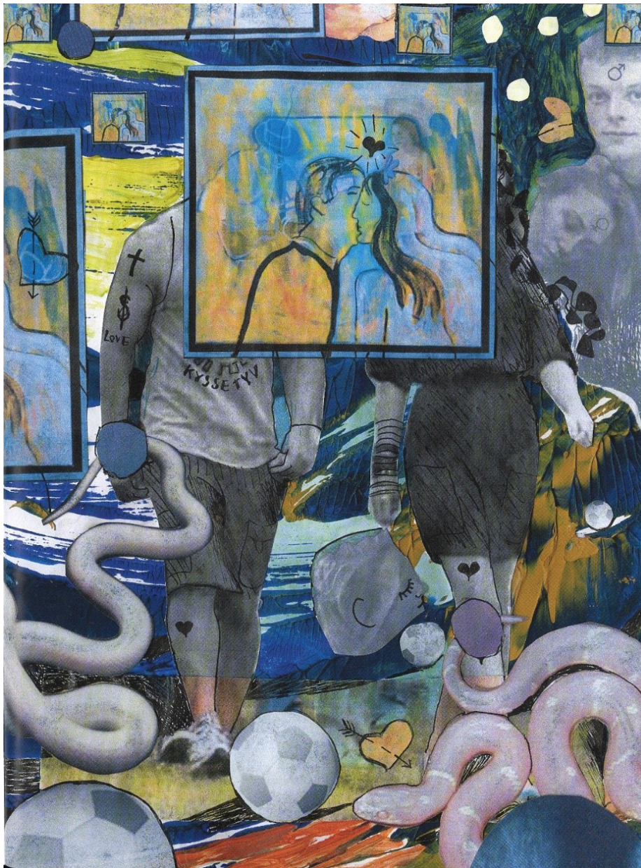
Lotte Kjøller fra Skrædder i Helvede , Antologi, 2011