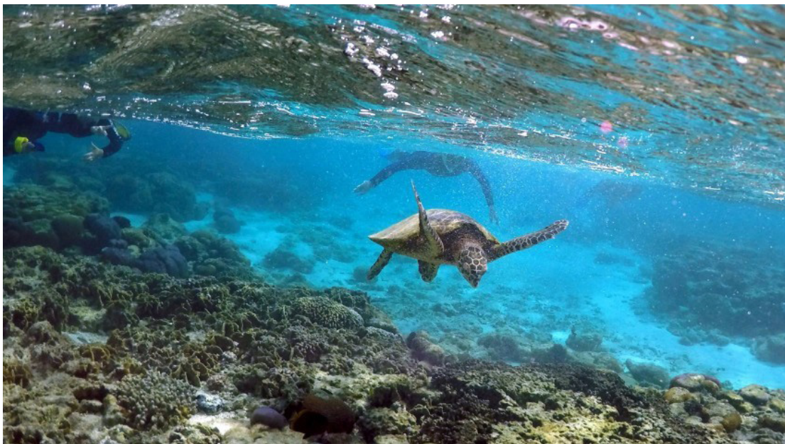
Alle arter af havskildpadder er truet af udryddelse.

Udviklingen truer menneskets eksistensgrundlag, lyder konklusionen fra 550 forskere, der har bidraget til rapporter om tab af biodiversitet i fire regioner på kloden.