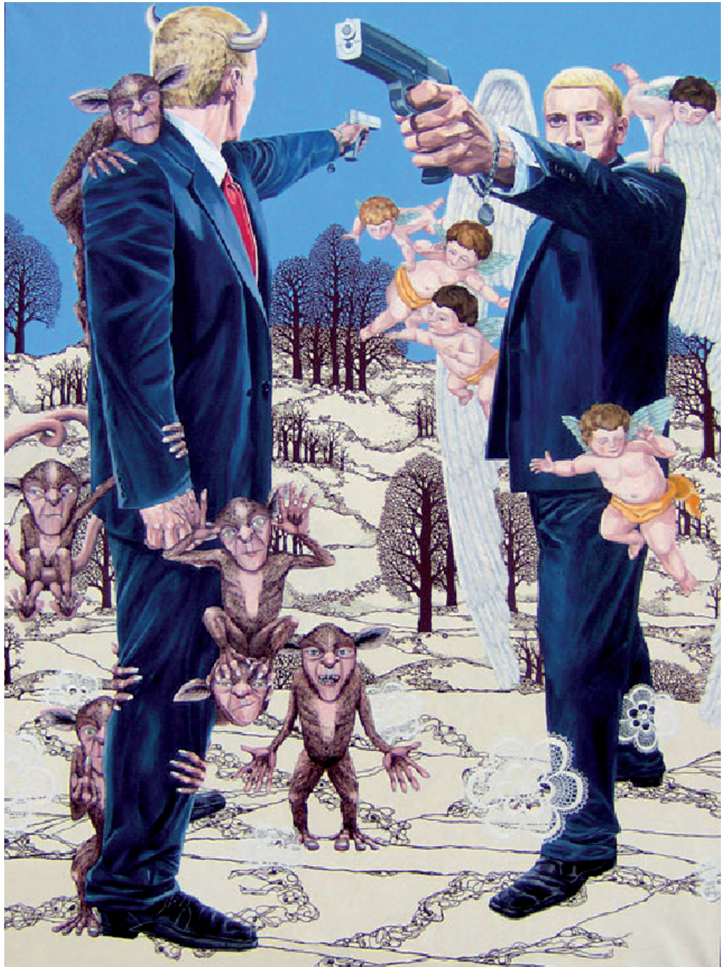
Beinta av Reyni: "Eminem aka Slim Shady", 2006 Olja á lørift, 270 x 200 cm