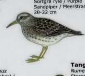
Grágrælingur Calidris maritima Sortgrá ryle / Purple Sandpiper / Meerstrandläufer 20-22 cm