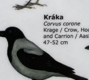
Kráka Corvus corone Krage / Crow, Hooded and Carrion / Aaskrähe 47-52 cm