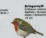
Bringureyði Erithacus rubecula Rødhals / European Robin / Rotkeiche 14 cm