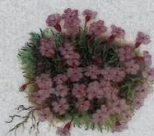
Leggstutt túvublóma Silene acaulis Tue-Límurt/Moss Campion/ Stengelloses-Leimkraut 2-5 cm