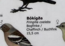
Bókígöa Fringilla coelebs Bogflinke / Chaffinch / Buchfink 15,5 cm