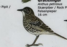
Grátítlingur Anthus petrosus Skærþiber / Rock Pipit / Felsenpieper 16 cm