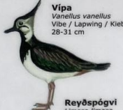
Vipa Vanellus vanellus Vibe / Lapwing / Kiebitz 28-31 cm