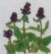
Trøllabátsmanshattur Prunella vulgaris Almindelig Brunelle/ Selfheal/Gemeine Braunelle 10-30 cm