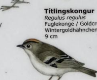
Títlingkongur Regulus regulus Fuglekonge / Goldcrest / Wintergoldhähnchen 9 cm