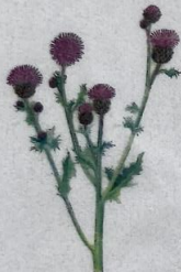
Akurtistil Cirsium arvense Ager-Tidsel/ Creeping Thistle/ Acker-Kratzdistel 50-120 cm