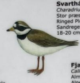
Svarthálsa Charadrius hiaticula Stor præstekræve / Ringed Plover / Sandregenpfeifer 18-20 cm