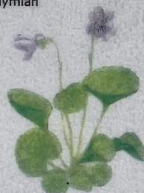
Ljós blákolla Viola palustris Eng-Viol/Marsh Violet/ Sumpf-Veilchen 3-15 cm