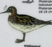
Helsareyði Phalaropus lobatus Odinshane / Red-necked Phalarope / Odinshünchen 18-19 cm