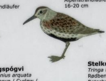
Fjallmurra Calidris alpina Almindelig ryle / Dunlin / Alpenstrandläufer 16-20 cm