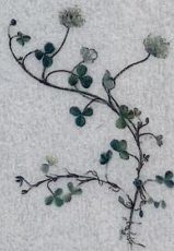
Seyðasmæra Trifolium repens Hvídklæver/White Clover/ Weiss-Klee 10-25 cm