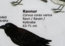
Ravnur Corvus corax varius Ravn / Raven / Kolkrahe 63-71 cm