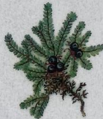
Tvíkynjaður berjalyngur Empetrum nigrum subsp. hermaphroditum Fjeld-Revling/ Mountain Crowberry/ Zwittrige Krähenbeere 15-45 cm