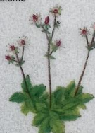
Stjørnusteinbrot Saxifraga stellaris Stjerne-Stenbræk/ Starry Saxifrage/ Stern-Steinbrech 5-25 cm