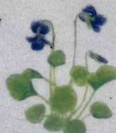
Dimm blákolla Viola riviniana Krat-Viol/Common Dog-violet/ Hain-Veilchen 5-20 cm