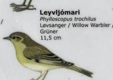
Leyvljómari Phylloscopus trochilus Lavsanger / Willow Warbler / Grüner 11,5 cm