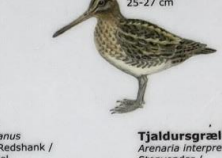
Mýrisnipa Gallinago gallinago Dobbelbækkasin / Snipe / Bekassine 25-27 cm