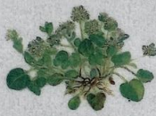
Læknaeirsgas Cochlearia officinalis Læge-Kokleare/ Common Scurvygrass/ Echtes Löffelkraut 5-30 cm