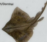
Skóta Dipturus batis Skade/Blue skate/ Glattrochen 285 cm