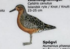
Íslandsgrælingur Calidris canutus Íslandsk ryle / Knot / Knutt 23-25 cm