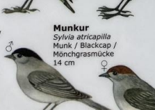
Munkur Sylvia atricapilla Munk / Blackcap / Mönchgrasmücke 14 cm