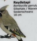
Reyðstapi Bombicilla garrulus Silkehaie / Waxwing / Seidenschwanz 18 cm