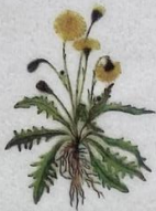
Vanlig heysthagasólja Leontodon autumnalis Hæst-Borst/Autum Hawkbit/ Herbst-Löwenzahn 5-40 cm