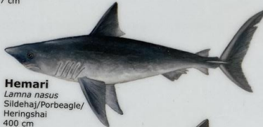
Hemari Lamna nasus Slidehaj/Porbeagle/ Heringshaj 400 cm