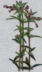
Eingjardúnurt Epilobium palustre Kær-Dueurt/ Marsh Willowherb/ Sumpf-Weidenröschen 10-40 cm