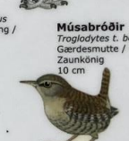
Músabróðir Troglodytes t. borealis Gardiesmutte / Wren / Zaunkönig 10 cm