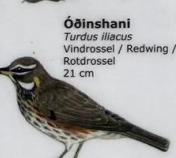
Óðinshani Turdus iliacus Vindrossel / Redwing / Rotdrossel 21 cm