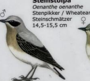
Steinstólpa Oenanthe oenanthe Stenþikkur / Wheatear / Steinschmätzer 14,5-15,5 cm