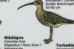
Tangspógvi Numenius arquata Storspeve / Curlew / Großer Brachvogel 50-60 cm