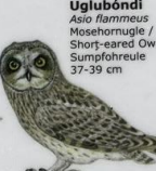
Uglubónði Asio flammeus Mosehornugle / Short-eared Owl / Sumföhreule 37-39 cm