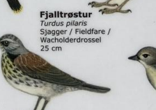
Fjalltrøstur Turdus pilaris Sjagger / Fieldfare / Wacholderdrossel 25 cm