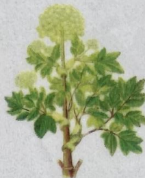
Heimahvonn, bjargahvonn Angelica archangelica Fjeld-Kvan/Garden Angelica/ Echte Engelwurz 50-200 cm