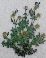
Fagurligt pirikum Hypericum pulchrum Smuk Perikon/ Slender St. John's-wort/ Schönes Johanniskraut 5-25 cm

Myndir: Astrid Andreassen - Útgáva: Náttúrugripasavnin vjð stuðli frá felagnum "Føroya Náttúru - Føroya Skúla" 1. útgáva - © 2011, Náttúrugripasavnin og Astrid Andreassen Prent: Føroyaprent, svanamerktur prentlitur 541 705