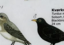
Kvørkveggja Turdus merula Solsort / Blackbird / Amsel 24 cm