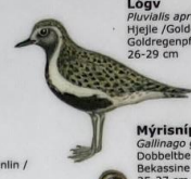
Lógv Pluvialis apricaria Hjelle / Golden Plover / Goldregenpfeifer 26-29 cm