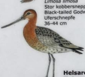
Reyðspógvi Limosa limosa Stor kobbersneppe / Black-tailed Godwit / Uferschnepfe 36-44 cm