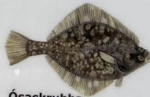
Ósaskrubba Platichthys flesus Skrubbe/Flounder/ Flunder 50 cm