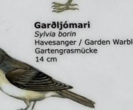
Garðljómari Sylvia borin Havesanger / Garden Warbler / Gartengrasmücke 14 cm