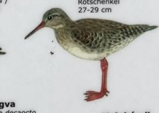
Stelkur Tringa totanus Rædben / Redshank / Rotschenkel 27-29 cm