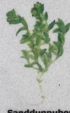
Sanddunnuber Honckenya peploides Almindelig Strandarve/ Sea Sandwort/ Strand-Salzmie 10-25 cm