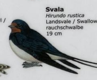
Svala Hirundo rustica Landsvale / Swallow / rauchschwalbe 19 cm