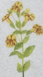
Blettut apublóma Mimulus guttatus Åben Abeblomst/ Monkeyflower/ Gefleckte Gauklerblume 20-50 cm