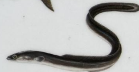
Állur Anguilla anguilla Ál/Eel/Aal 150 cm