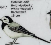
Erla Kongsdóttir Notocilla alba Hvíd vipstjert / White Wagtail / Bachstelze 18 cm