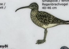
Spógvi Numenius phaeopus Smáspeve / Whimbrel / Regenbrachvogel 40-46 cm