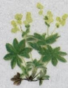
Føroyaskøra Achemilla faeroensis Færøsk Løvefod/ Faroese Lady's-mantle/ Färingar Frauenmantel 10-40 cm