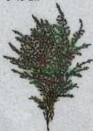
Vanligur heiðalyngur Calluna vulgaris Heiðalyng/Heather/ Heidekraut, Gemeine Besenheide 10-50 cm