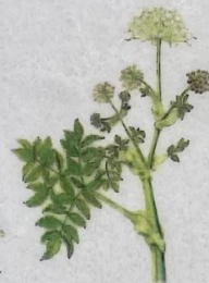
Bakkasløkja Angelica sylvestris Angelik/Wild Angelica/ Wald-Engelwurz 30-100 cm