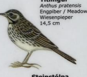
Títlingur Anthus pratensis Engþiber / Meadow Pipit / Wiesenspieper 14,5 cm