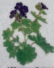
Litingarsortugras Geranium sylvaticum Skov-Storkenæb/ Wood Crane's-bill/ Wald-Storchschnabel 15-60 cm