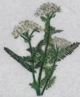
Margblømdur rølikur Achillea millefolium Almindelig Røllike/Yarrow/ Gemeine Schafgarbe 8-60 cm