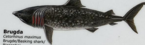
Brugða Cetorhinus maximus Brugðe/Basking shark/ Riesenhai 1000 cm