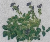
Lækna bládepla Veronica officinalis Læge-/Erenpreis/ Heath Speedwell/ Wald-Ehrenpreis 5-25 cm