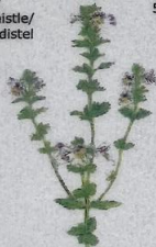
Læknaeygnagras Euphrasia officinalis Øjentrøst/Eyebright/ Gemeine Augentrost 5-15 cm