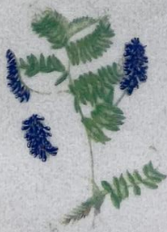
Skrykkjukrøkja Vicia cracca Muse-Vikke/Tufted Vetch/ Vogel-Wicke 10-40 cm