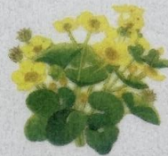
Vanlig myrisólja Caltha palustris Eng-Kabbeleje/ Marsh-marigold/ Sumpf-Dotterblume 10-50 cm