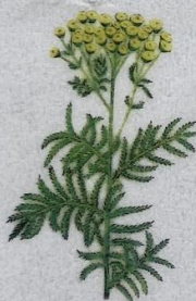
Vanlig reinfann Tanacetum vulgare Rejnfann/Fansy/ Rainfann 30-150 cm