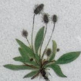
Jóansøkugotubrá Plantago lanceolata Lancet-Vejbred/ Ribwort Plantain/ Spitz-Wegerich 10-40 cm