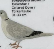
Turkadúgva Streptopelia decaocto Tyrkerdue / Collared Dove / Türkentaube 31-33 cm