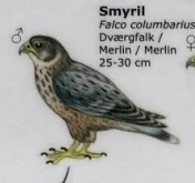
Smyril Falco columbarius Dvergfalck / Merlin / Merlin 25-30 cm