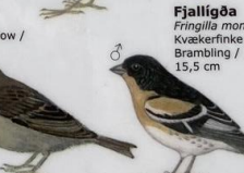
Fjalligöa Fringilla montifringilla Kvækerflinke / Brambling / Bergfink 15,5 cm