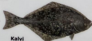
Kalvi Hippoglossus hippoglossus Helleflynder/Halibut/Heilbutt 350 cm