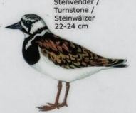
Tjaldursgrælingur Arenaria interpres Stævender / Turnstone / Steinwäzler 22-24 cm